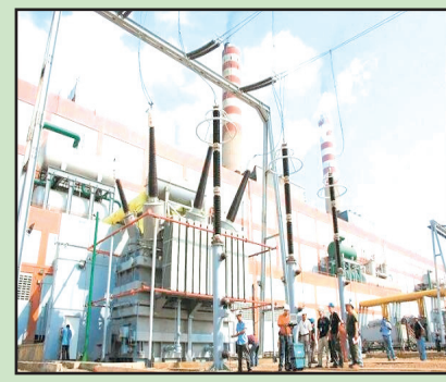
La subestación estuvo "caída" por cinco horas

ción se prolongó durante varias horas, generando malestar e inconvenientes en la población. Aunque algunos sectores de la península de Paraguaná reportaron la restitución del servicio eléctrico alrededor de las 11:30 de la mañana, aún se desconoce el alcance total de la afectación en los tres estados involucrados. Las fallas eléctricas de corta y larga duración se ha repetido en las últimas semanas tras el apagón nacional del 30 de agosto. Las autoridades alegaron que se trata de una serie de "ataques contra el sistema eléctrico" y un "ataque cibernético" contra la central hidroeléctrica Guri sobre el cual no se han dado mayores detalles.